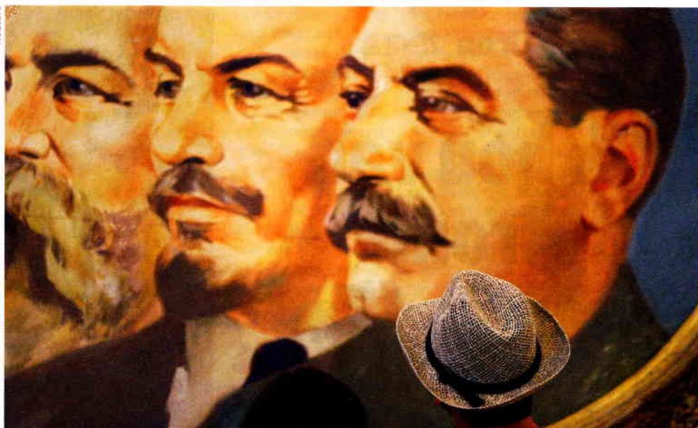
'LENIN EN STALIN hebben het systeem van Ivan de Verschrikkelijke geperfectioneerd, door de repressie nog gruwelijker te maken.'

'Veel Russen hebben een soort sado-masochistische verhouding tot de machthebbers.'